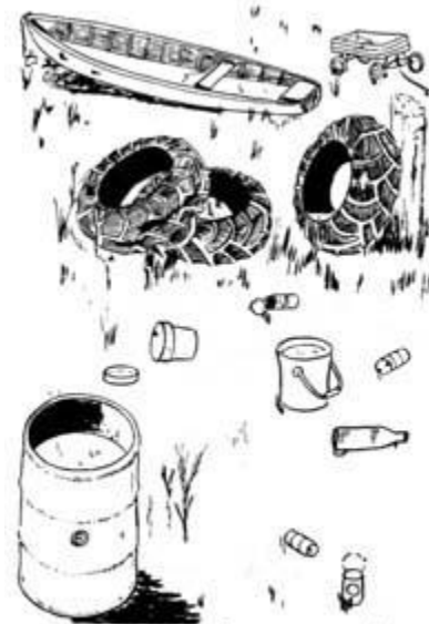
Empty water from mosquito breeding sites around the home